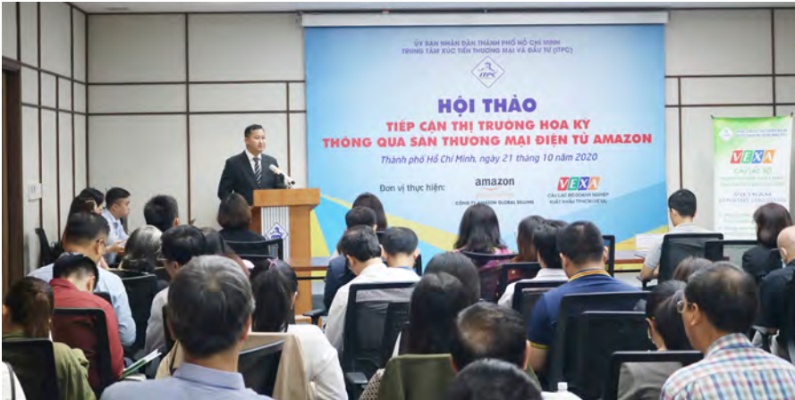
Các hoạt động xúc tiến của ITPC được các cơ quan báo chí thông tin tạo hiệu ứng tốt về mặt truyền thông