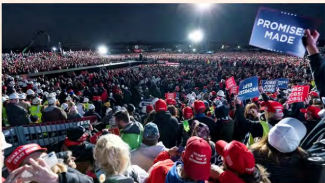
President Donald Trump speaks at a campaign rally at Pittsburgh-Butler Regional Airport on Saturday in Pennsylvania.

Surge in coronavirus cases hangs over US election as number of early votes passes 90m